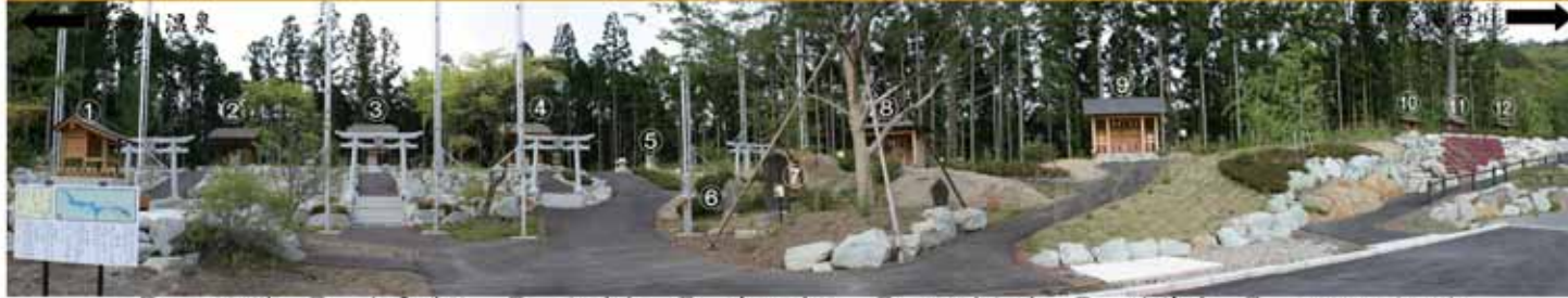
①...不動様 ②...高房神社 ③...太神宮 ④...春日神社 ⑤...八幡大神 ⑥...勝善神 ⑦...西川山林の碑 ⑧...西川九地蔵 ⑨...上野地蔵 ⑩...山の神様(万葉沢) ⑪...山の神様(赤下沢) ⑫...山の神様(奥田坂沢)